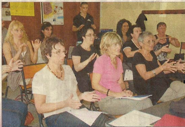
Apprendre les mots de base de la langue des signes française, voici ce qu'ont choisi les stagiaires de la SEM 24-47.

En cette première séance dans la salle Combefis, l'image donnée